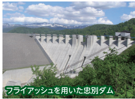
フライアッシュを用いた忠別ダム