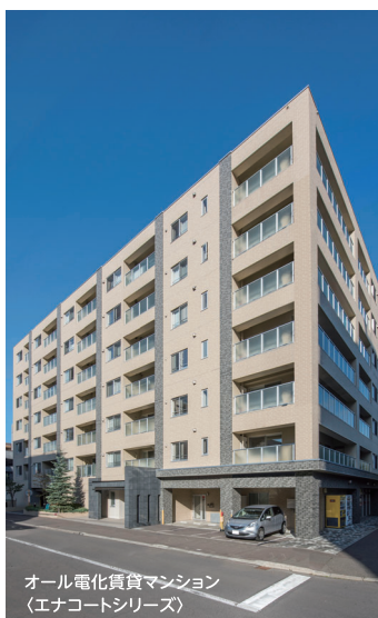
オール電化賃貸マンション(エナコートシリーズ)