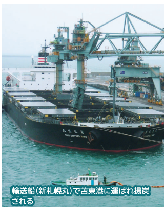
輸送船(新札幌丸)で苫東港に運ばれ揚炭される