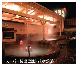
スーパー銭湯(湯処 花ゆづき)