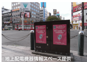
地上配電機器情報スペース提供