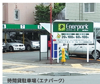
時間貸駐車場(エナパーク)