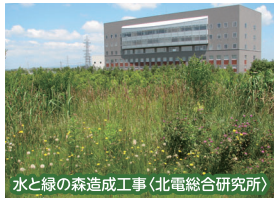
水と緑の森造成工事(北電総合研究所)