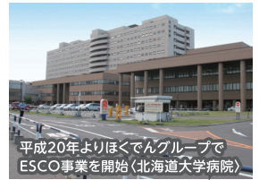
平成20年よりほくでんグループでESCO事業を開始(北海道大学病院)